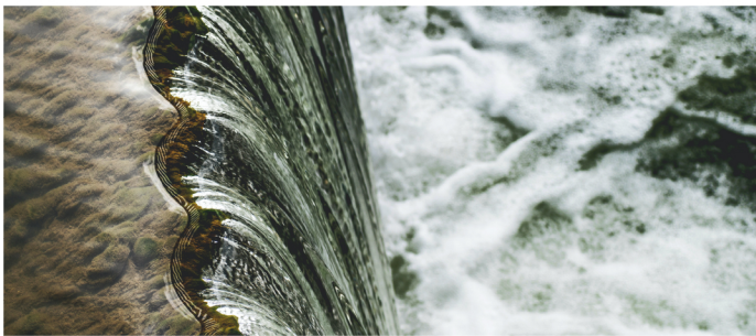
VCS 964 Uzundere | 63.0 MW Wasserkraftsprojekt